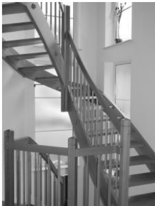
Abb. Holztreppe: beispielhaft

Alternativ Holztreppe in Buche ohne Setzstufen (siehe Bild)